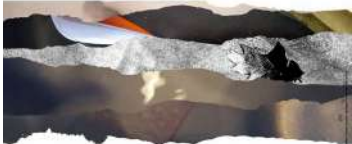
Exposition de Photographies

Carinne Agnès, Marie-Thé A., Zina Anouk-Lemière, Ana Bobi, Leslie Bradburn, Alessandra Carlen-Checchia, Laurence David, Pierre Giron, Haklago, Sophie Letessier, Alexandre Morelli, Tania Tan, Franco Verrich